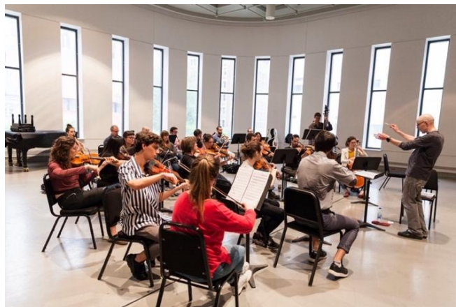
Galileo | Daniel Constantineau

Par ailleurs, l'Orchestre est un OBNL inscrit en tant qu'organisme de bienfaisance auprès de l'ARC et promeut à ce titre la formation et le développement musical de son public en général et des jeunes en particulier.