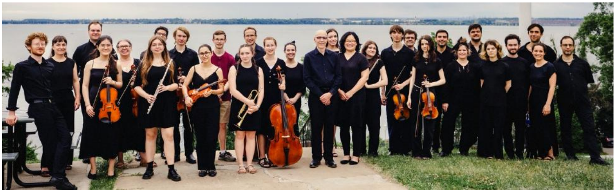
Galileo et l'Orchestre symphonique des jeunes de Vaudreuil-Soulanges avant le concert « Mendelssohn à l'école ! » du 20 juin 2024, donné à l'Église Sainte-Jeanne-de-Chantal de l'Île Perrot.

> Effectifs: Galileo: 33 instrumentistes, une soliste, un chef | OSJVS: n. d'instrumentistes et œuvres à être annoncés | Concert en présentiel